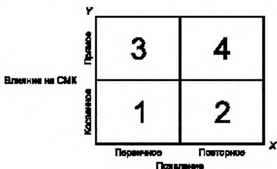
Рисунок 2 — Матрица градаций