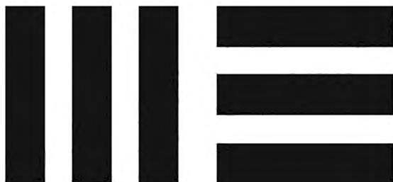
Рисунок 2 — Тест-объект для проверки разрешающей способности

ры (см. рисунок 2). В центральном объекте фигуры должны быть расположены горизонтально и вертикально. В периферийном объекте фигуры должны быть расположены радиально и по касательной.