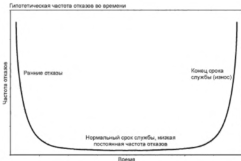
Рисунок В.1 — Модель U-образной кривой частот отказов электронных элементов

Начальная фаза часто используется изготовителем во время рабочих испытаний для того, чтобы гарантировать изготовление надежных элементов. Данные отказы обнаруживаются во время пусконаладочных работ или ранней эксплуатации. Две последних фазы эксплуатации непосредственно относятся к старению. Существуют установленные модели и параметры для надежности электронного элемента при нормальной эксплуатации. Однако отсутствуют сопоставимые установленные модели для фазы конца срока службы. Поскольку известно, что сроки службы одинаковых элементов при сходном их применении значительно различаются, такая модель, вероятно, будет отражать специфику конкретного применения. Для оценки конца срока службы могут быть разработаны эмпирические модели, если имеется достаточно данных предыстории о рабочих характеристиках и условиях эксплуатации рассматриваемого оборудования.