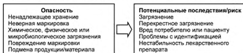
Рисунок С.2 — Примеры рисков и потенциальных последствий

В отношении каждой опасности, по которой отсутствуют меры контроля, должны оцениваться последствия и вероятность возникновения (получая информацию от потребителей по мере необходимости).