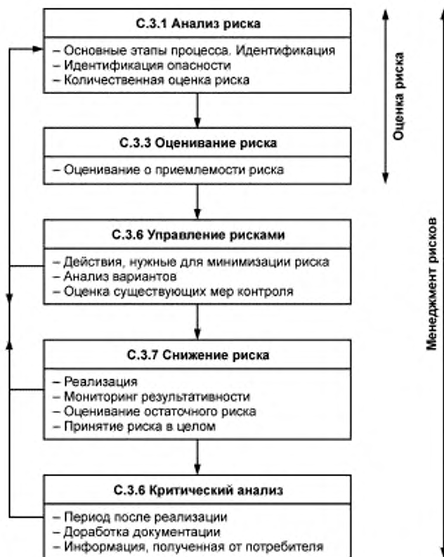
Рисунок С.1 — Схематическое представление процесса менеджмента рисков