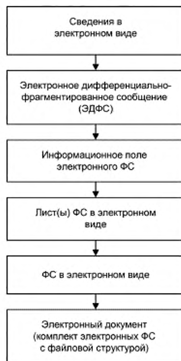
Рисунок Д.1 — Схема создания документов на электронных носителях информации в виде комплекта электронных форматов сообщений