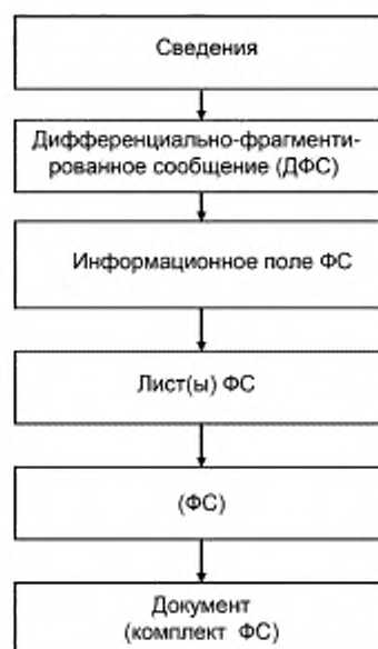
Рисунок Г.1 — Схема создания документов на бумажных носителях информации в виде комплекта бумажных ФС (основной вариант)