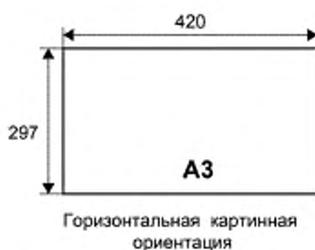
Рисунок В.2 — Ориентация листа ЕТФС при его применении для разработки ФС