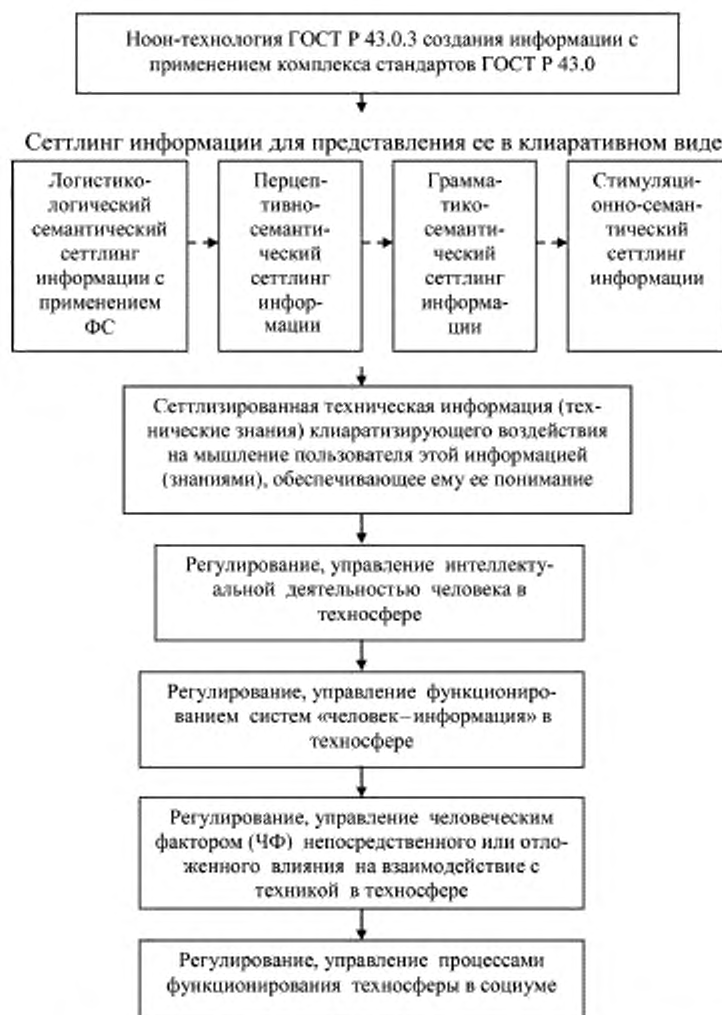
Рисунок А.1 — Схема применения ноон-технологии в регулировании, управлении процессами функционирования техносферы