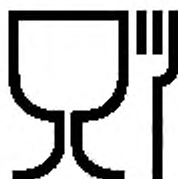
Рисунок Б.1 — Для пищевых продуктов

Б.2 Символ, характеризующий кронен-пробки по назначению, наносят на упаковочный ярлык или упаковочный лист (вкладыш) или указывают в сопроводительной документации — см. рисунок Б.1.