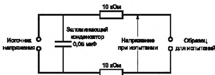
Рисунок 1 — Электрическая схема для испытания напряжением постоянного тока

Испытания напряжением постоянного тока проводят, используя схему рисунка 1.