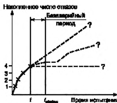
Рисунок 1 — Построение кривой отказов

В этом методе накопленное число учитываемых отказов представляют как функцию времени испытания для каждой отдельной системы. Как только обнаруживают учитываемый отказ, кривую корректируют. Трудность заключается в оценке того, как кривая может быть продолжена в будущем (см. рисунок 1).