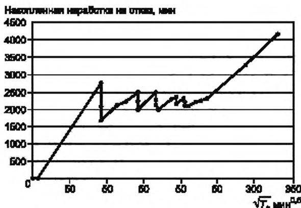
Рисунок Б.1 — График роста безотказности по данным таблицы Б.1