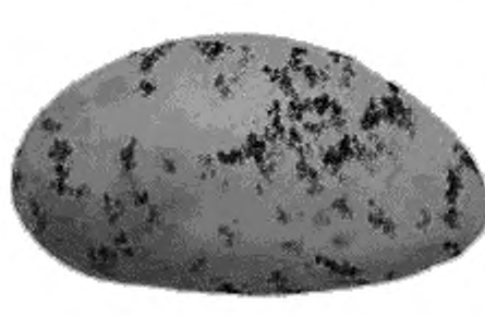
Рисунок 4 — Ризоктония [3] (поражено 10 % поверхности клубня)

При определении поражения клубней паршой серебристой учитывают только клубни, потерявшие тургор, сморщенные, а также клубни, имеющие повреждение глазков.