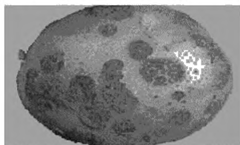
Рисунок 1 — Парша обыкновенная [3] (поражено 33,3 % поверхности клубня)

6.5.2 Определение площади пораженной поверхности клубня паршой (обыкновенная, сетчатая, порошистая) и ризоктонией — по [3]. Клубень считается пораженным болезнью, если площадь пораженной поверхности паршой обыкновенной превышает 33,3 % или более \frac{1}{3} поверхности (см. рисунок 1), паршой сетчатой — 33,3 % (см. рисунок 2), паршой порошистой — 10 % (см. рисунок 3), ризоктонией — 10 % (см. рисунок 4).