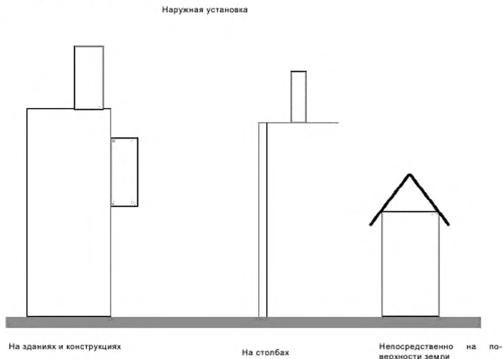
Рисунок 2 – Расположение корпусов для наружной установки

У корпусов для наружной установки может быть самое различное местоположение. На рисунке 2 показаны три основных места установки.