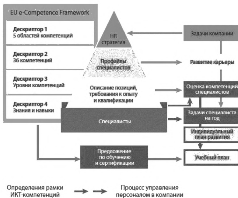
Рисунок 1 — Примеры применения дескриптора 4 в организациях

Дескриптор 4 относится к дескриптору 2, но не относится к дескриптору 3. Хотя дескриптор 3 может быть использован для проведения соответствия с EQF и применимости определенных знаний и навыков.