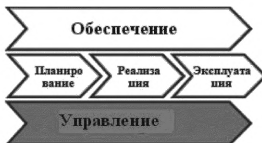
Рисунок 2 — Основные компоненты бизнес-процессов в ИКТ

2. Бизнес-процессы в ИКТ имеют основные компоненты: планирование, реализация, эксплуатация, обеспечение, управление. Этапы реализации и эксплуатации являются основными, этапы обеспечения и управления пронизывают их, связывая между собой. Этапы планирования и обеспечения являются стратегическими этапами для компаний, которые предлагают и разрабатывают решения, конфигурируют и разрабатывают продукты, сервисы, виды деятельности и правила. Этапы реализации и эксплуатации сопровождают ежедневную деятельность по управлению и улучшению бизнеса.