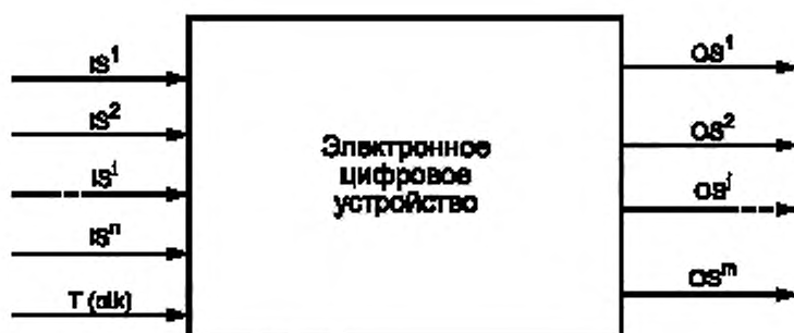
Рисунок 1 — Физическое представление устройства

6.1.4 Работа устройства тактируется одним из входных сигналов либо от одного внутреннего генератора, входящего в состав устройства. На входные контакты краевых разъемов могут подаваться входные цифровые тестовые воздействия, а с выходных контактов этих разъемов может быть снята реакция (выходные цифровые сигналы) устройства на входные воздействия. Сопоставление полученных реакций с эталонными позволяет сделать вывод о работоспособности ОК и осуществлять диагностику обнаруженных неисправностей. Совокупность входных воздействий и соответствующие им эталонные реакции ОК представляют собой тест.