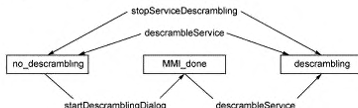
Рисунок 3 — Изменение состояния системы CA

По умолчанию система (класс CAModule) устанавливается в состояние «дескремблирование не введено». В этом состоянии дескремблирование не выполняется. Переход в состояние «дескремблирование введено» может быть выполнен двумя способами. Первый способ реализуется прямым вызовом метода startDescrambling. После вызова этой функции начинается процесс дескремблирования. В этом случае представление информации может включать диалоги пользователя по запросам системы CA. Если дескремблирование при использовании первого способа невозможно, то применяется второй способ, который заключается в вызове метода startDescramblingDialog. Это заставляет систему CA в случае необходимости начинать диалог с пользователем и ввести состояние «готовность интерфейса MMI» MMI_done. После этого состояния «дескремблирование введено» может быть достигнуто вызовом метода startDescrambling.