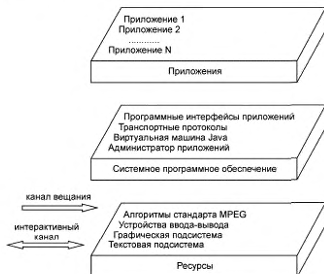
Рисунок 1 — Базовая архитектура МНР

5.3.2 Приложения платформы представляют собой функциональные реализации программного обеспечения, работающие в одном или в нескольких взаимодействующих аппаратных объектах.