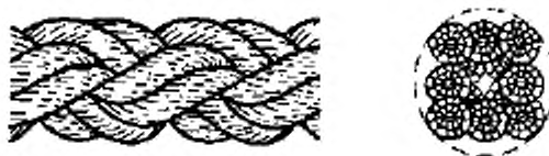
Рисунок 2 – Конфигурация 8-рядного плетеного каната (тип L)