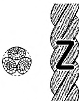
Рисунок 1 – Конфигурация 3-рядного (hawser-laid) каната (тип А)

6.2 Конструкция, изготовление, шаг скрутки, маркировка, упаковка, выставление счета-фактуры и поставляемые длины должны соответствовать требованиям ИСО 9554.