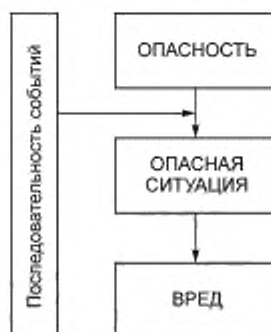
Рисунок А.1 — Взаимосвязь между последовательностью событий, ВРЕДОМ и ОПАСНОСТЬЮ

Согласно определениям в ИСО 14971, ОПАСНОСТЬ не может привести к вреду до тех пор, пока последовательность событий или других обстоятельств (включая условия нормального применения) не приведет к возникновению ОПАСНОЙ СИТУАЦИИ (см. рисунок А.1). Эта последовательность событий может включать как единичные события, так и комбинации событий. Приложение D.2 ИСО 14971 дает представление об ОПАСНОСТЯХ и ОПАСНЫХ СИТУАЦИЯХ. Приложение Е ИСО 14971 дает представление о примерах ОПАСНОСТЕЙ, прогнозируемых последовательностях событий и ОПАСНЫХ СИТУАЦИЯХ.