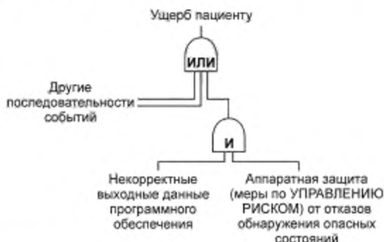
Рисунок 2 — FTA (анализ дерева неисправностей) показывает меру по УПРАВЛЕНИЮ РИСКОМ, которая препятствует неправильным выходным данным программного обеспечения причинить ВРЕД

выходных данных (например, путем прекращения работы). Неверные данные на выходе программного обеспечения могут нанести ущерб пациенту, только если откажет мера по УПРАВЛЕНИЮ РИСКОМ. Следует заметить, что последовательность событий, приводящая к неправильным данным на выходе программного обеспечения, не нуждается в детальном изучении, чтобы убедиться, что она не может привести к нанесению ущерба пациенту.