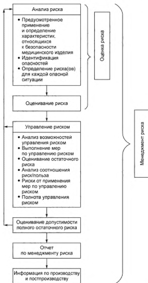
Рисунок 1 — Схематичное представление ПРОЦЕССА МЕНЕДЖМЕНТА РИСКА

БЕЗОПАСНОСТЬ является свойством СИСТЕМЫ (в данном случае всего МЕДИЦИНСКОГО ИЗДЕЛИЯ), которая включает программное обеспечение. МЕНЕДЖМЕНТ РИСКА должен осуществляться в рамках СИСТЕМЫ, включая программное обеспечение и всю ее аппаратную среду. Деятельность по МЕНЕДЖМЕНТУ РИСКА программного обеспечения не должна проводиться в отрыве от СИСТЕМЫ.