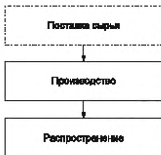
Схема 1 — Упрощенный пример цепочки поставки дров

Цепочка поставки имеет три части, как показано на схеме 1.