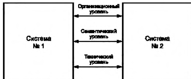
Рисунок 1 — Эталонная модель интероперабельности

Эталонная модель интероперабельности представляет собой развитие семиуровневой базовой эталонной модели ВОС согласно ГОСТ Р ИСО/МЭК 7498-1—99 (рисунок 1), [3], [4].