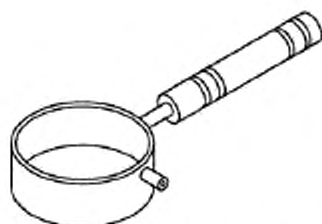
Рисунок 3 — Металлический или керамический ковш с ручкой для розлива воска