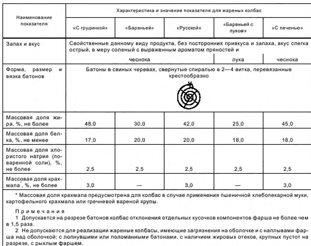
Окончание таблицы 2

5.2.2 Микробиологические показатели жареных колбас не должны превышать норм, установленных санитарными правилами и нормами, гигиеническими нормативами или нормативными правовыми актами, действующими на территории государства, принявшего стандарт.