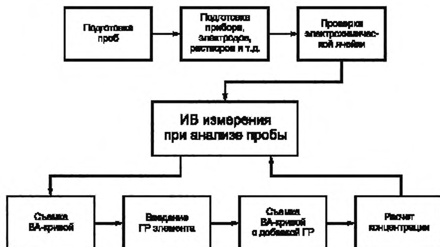
Рисунок 1 — Основные этапы анализа проб методом ИВ

ном минус 1,0 В отн. ХСЭ. Процесс электрорастворения мышьяка (0) с поверхности электрода проводят при линейном или дифференциально-импульсном режиме изменения потенциала в положительную сторону до потенциала растворения золота. Потенциал анодного пика мышьяка находится в интервале от +0,01 до +0,05 В при pH раствора 3—4.