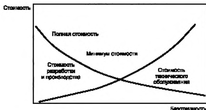
Рисунок 1 — Зависимость стоимости от безотказности

На оптимальную безотказность системы могут влиять и другие аспекты, такие как требования к безопасности.