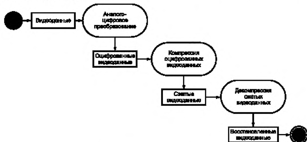
Рисунок 1 — Общая схема работы ЦСОТ

Общая схема работы ЦСОТ с точки зрения использования алгоритмов компрессии и декомпрессии представлена на рисунке 1.