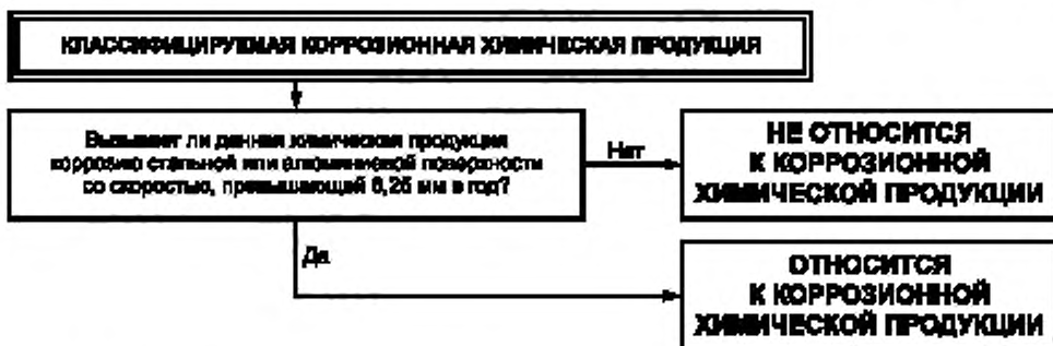
Рисунок 1 — Процедура классификации опасности коррозионной химической продукции

Процедура классификации опасности коррозионной химической продукции представлена на рисунке 1.