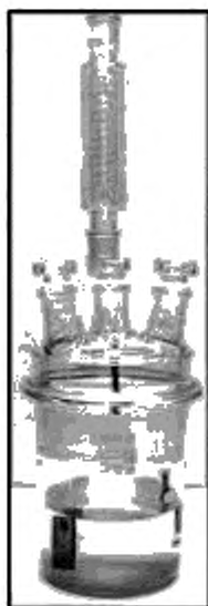
Рисунок 3 — Реакционный сосуд с парциальным конденсатором

Чашеобразный реакционный сосуд из стекла или политетрафторэтилена (рисунок 3) имеет три горловины соответствующего размера (например, стандартный шлиф NS 92.32) для размещения образцов и одну горловину соответствующего размера (например, стандартный шлиф NS 14) (см. [2]) для парциального конденсатора. В сосуд необходимо обеспечить приток воздуха. Алюминиевые и стальные образцы проходят испытания в различных реакционных сосудах.