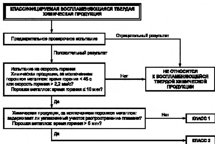
Рисунок 1 — Процедура классификации воспламеняющейся химической продукции, находящейся в твердом состоянии

4.1.2 Процедура классификации воспламеняющейся химической продукции, находящейся в твердом состоянии, представлена на рисунке 1.