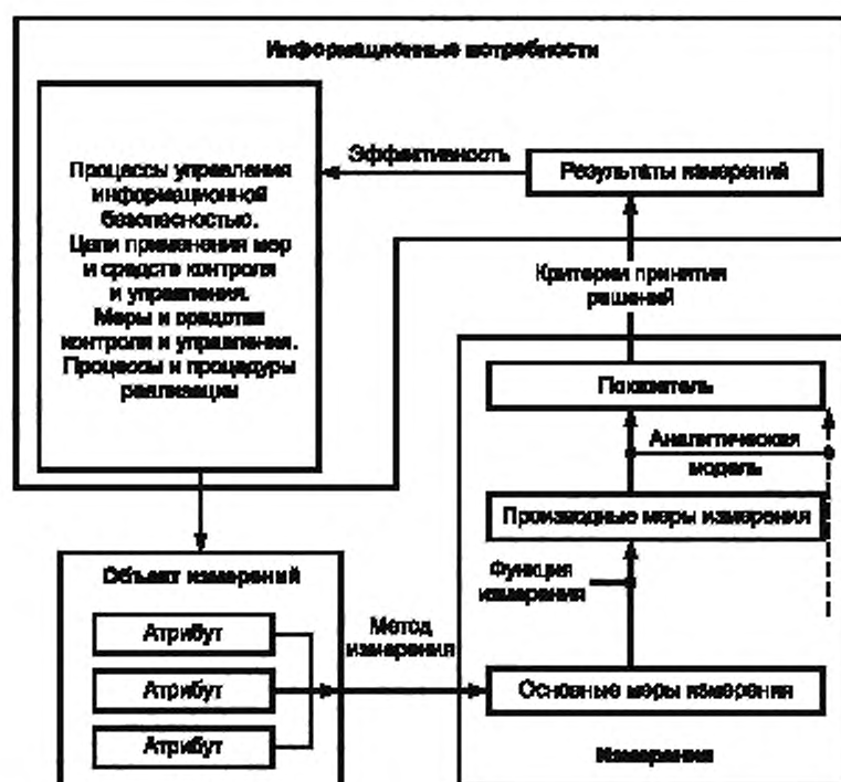
Рисунок 2 — Модель измерений

Модель измерений описывает, как соответствующие атрибуты количественно оцениваются и преобразуются в показатели, служащие основой для принятия решений. Модель измерений показана на рисунке 2.