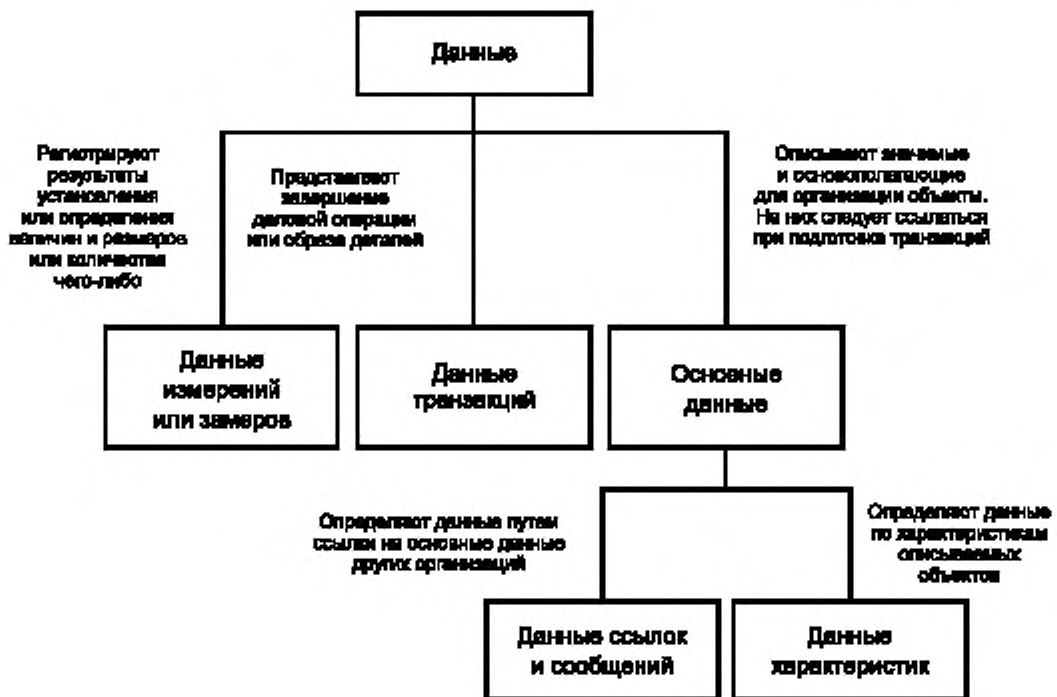
Рисунок 1 — Таксономия данных

Пример 3 — Идентификатор налога с доходов корпорации, номер индивидуального страхового полиса, номер детали, назначенный производителем произведенному изделию, — все это примеры идентифицирующих ссылок.