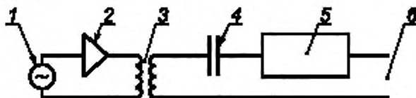
1 — генератор сигналов; 2 — широкополосный усилитель с регулируемым усилением; 3 — трансформатор с коэффициентом трансформации 1; 4 — конденсатор емкостью 2 мкФ; 5 — резистор сопротивлением 50 Ом; 6 — выходные зажимы устройства связи

При проведении испытаний применяют испытательную установку по приложению А, а также генератор сигналов и устройство связи в соответствии с рисунком 2.