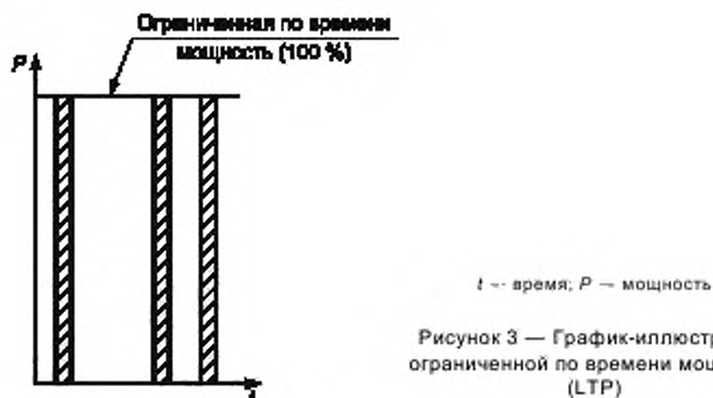
Рисунок 3 — График-иллюстрация ограниченной по времени мощности (LTP)