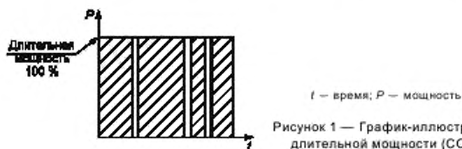
Рисунок 1 — График-иллюстрация длительной мощности (COP)

Изготовитель устанавливает выходные мощности 13.3.1—13.3.4 (рисунки 1—4) для требуемых условий с учетом рекомендаций изготовителей двигателей, генераторов переменного тока, измерительной и коммутационной аппаратуры по техническому обслуживанию и ремонту.