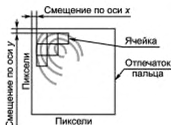
Рисунок 2 — Фрагментация изображения отпечатка пальца

В общем случае фрагментация представляет собой разделение центральной или другой части изображения отпечатка пальца на сеть перекрывающихся или неперекрывающихся ячеек. Первой ячейкой считают ячейку, находящуюся слева сверху изображения отпечатка пальца. Начало координат первой ячейки может не совпадать с началом координат изображения отпечатка пальца. В этом случае начало координат первой ячейки определяют по смещению по оси абсцисс x и оси ординат y относительно начала координат изображения отпечатка пальца (рисунок 2). Если в результате фрагментации справа и снизу изображения остаются пиксели, не образующие полноразмерную ячейку, данные пиксели должны быть удалены.