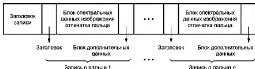
Рисунок 5 — Запись спектральных данных изображения отпечатка пальца

3) блока дополнительных данных, включающего в себя данные, определяемые производителем биометрического оборудования.