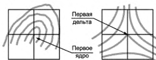
Рисунок 6 — Неперекрывающиеся ячейки, выровненные по первому ядру и первой дельте

Подобное выравнивание предполагает, что расположение первого ядра (или дельты) определяет положение угла одной или более ячеек. На рисунке 6 в качестве примера показаны первое ядро и первая дельта, определяющие положение угла четырех неперекрывающихся ячеек.