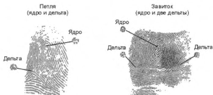
Рисунок 7 — Примеры расположения ядер и дельт