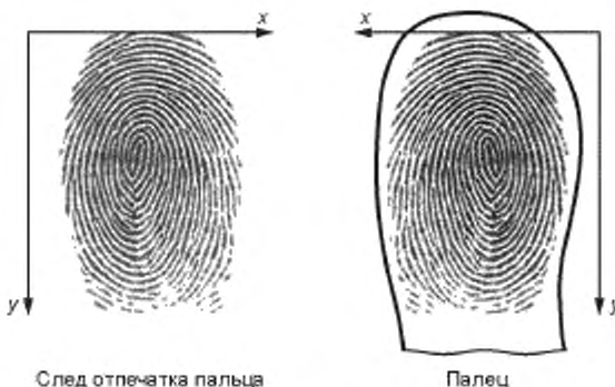
Рисунок 1 — Система координат

В настоящем стандарте устанавливается Декартова система координат xu . Начало системы координат изображения должно находиться в левом верхнем углу исходного изображения. Ось x в соответствии с общепринятым в цифровой обработке изображений допущением должна быть направлена слева направо, ось u — сверху вниз. Для системы координат, расположенной на пальце, при взгляде на подушечку пальца ось x должна быть направлена справа налево (рисунок 1). Все значения координат x и u должны быть неотрицательными.