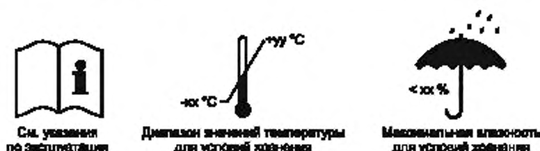
Рисунок 2 — Пиктограммы

в) рекомендуемые изготовителем условия хранения (температура и влажность) или эквивалентная пиктограмма согласно рисунку 2.