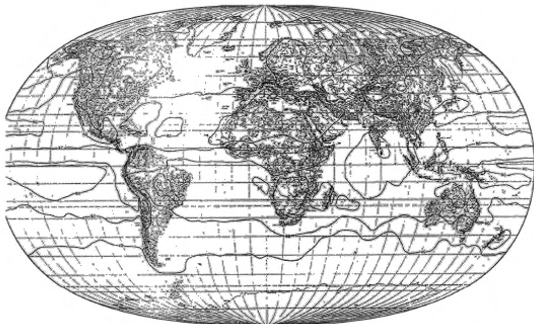
Рисунок А.1 — Средняя энергетическая суточная экспозиция за июнь (в процентах)