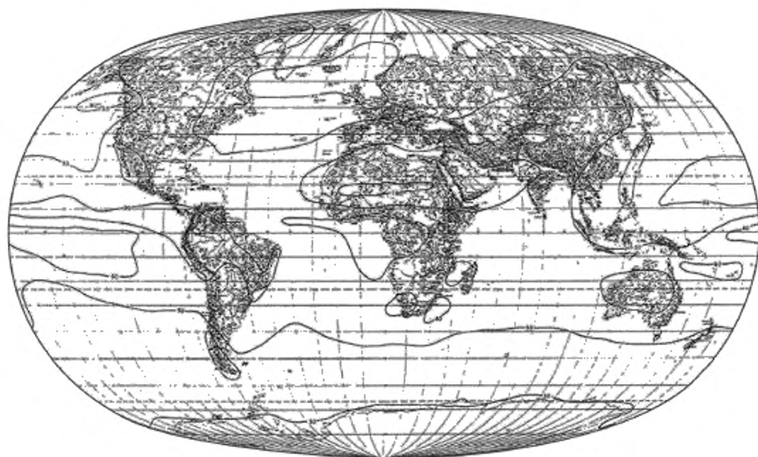
Рисунок А.3 — Средняя энергетическая суточная экспозиция за год (в процентах)