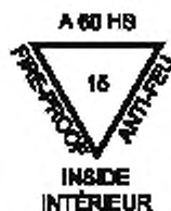
Рисунок 2 — Пример маркировки

Пример маркировки прозрачного термически закаленного безопасного стекла с основным стеклом толщиной 15 мм, имеющего тип огнестойкости «A-60», приведен на рисунке 2.