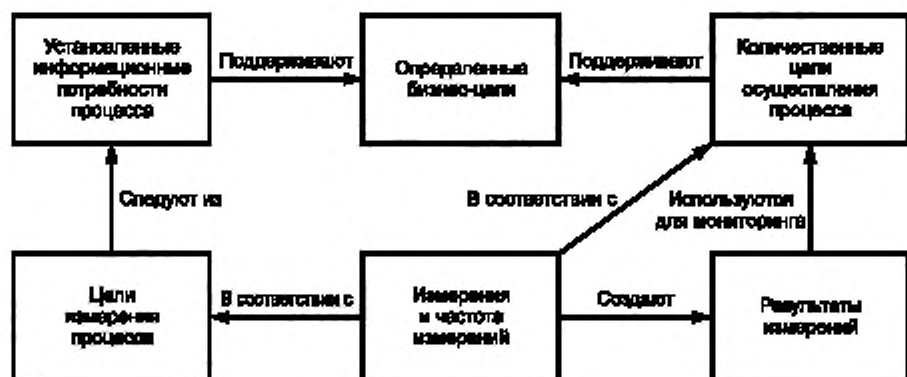
Рисунок 1 — Взаимосвязи между понятиями, относящимися к атрибуту измерения процесса

На рисунке 1 показаны взаимосвязи между некоторыми важными понятиями, относящимися к атрибуту измерения процесса.