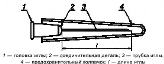
Рисунок 1 — Пример типовой инъекционной иглы однократного применения и предохранительного колпачка

Номенклатура составных частей инъекционных игл однократного применения представлена на рисунке 1 вместе с обозначением длины l . Обозначения размеров и геометрических форм острия иглы представлены на рисунке 2.