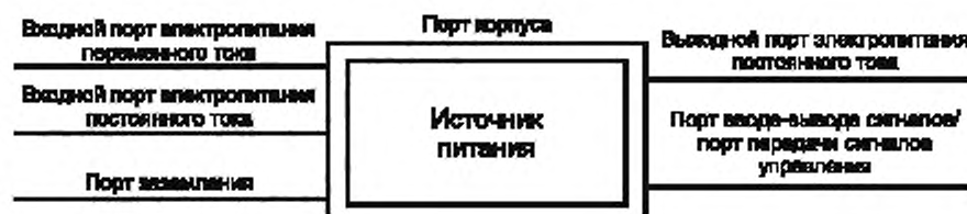
Рисунок 1 — Примеры портов источника питания

Примечание — Примеры портов см. на рисунке 1.