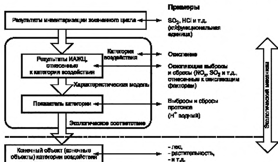
Рисунок 3 — Концепция показателей категории