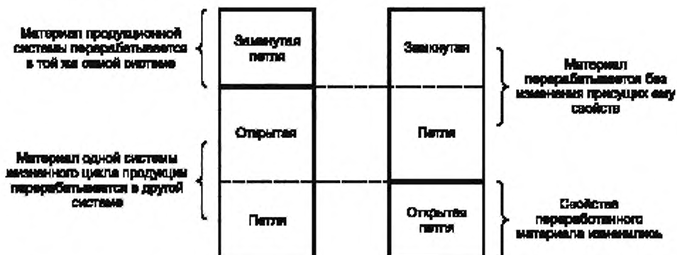
Рисунок 2 — Отличие между техническим описанием производственной системы и процедурами распределения для рециклинга

4.3.4.3.4 При использовании процедуры распределения для общих единичных процессов, указанных в 4.3.4.3, в качестве основы для распределения, если это осуществимо, следует использовать следующие показатели: