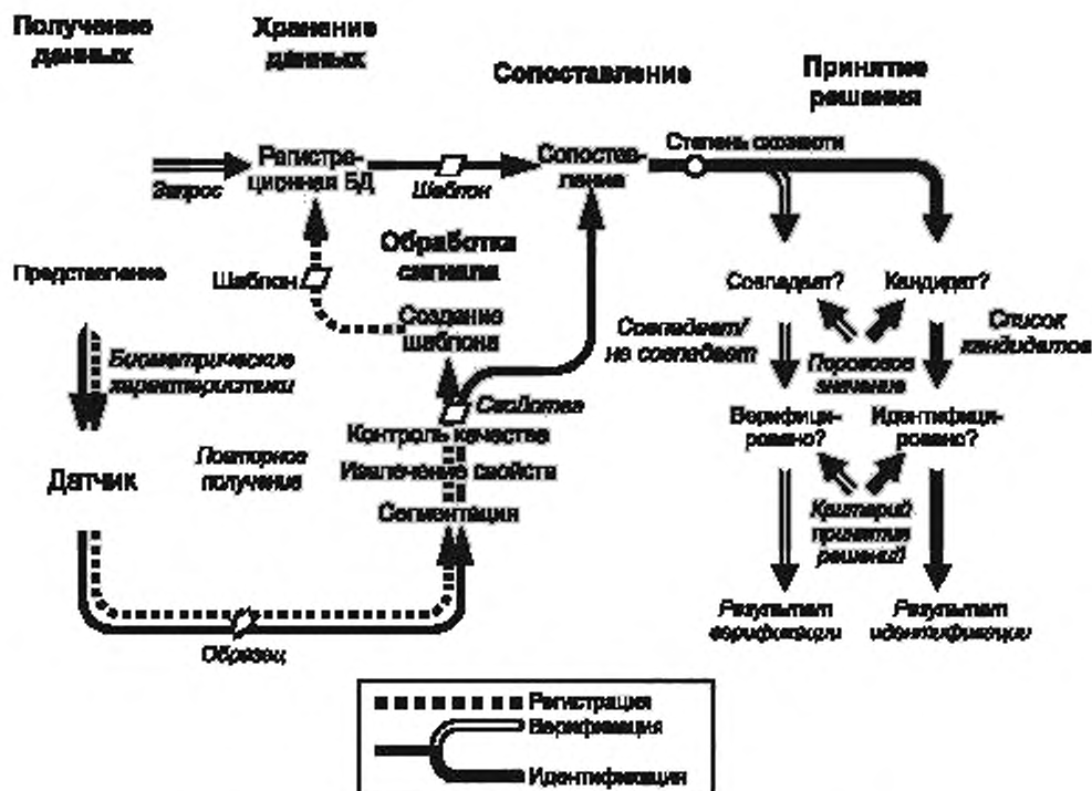
Рисунок 2 — Компоненты обобщенной биометрической системы