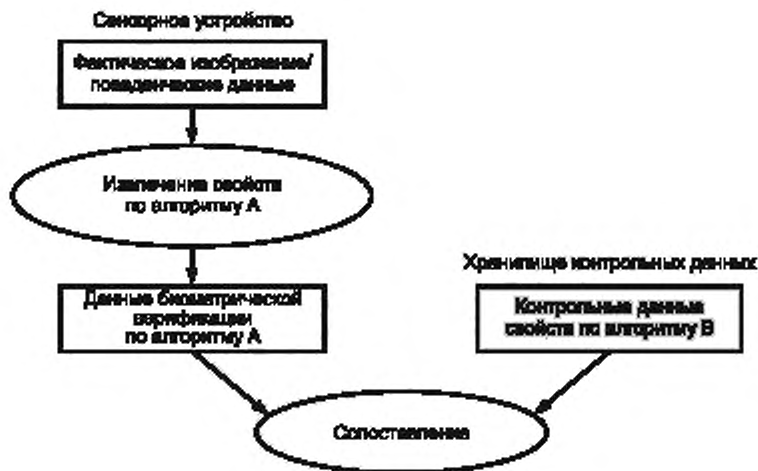
Рисунок А.2 — Использование данных свойств