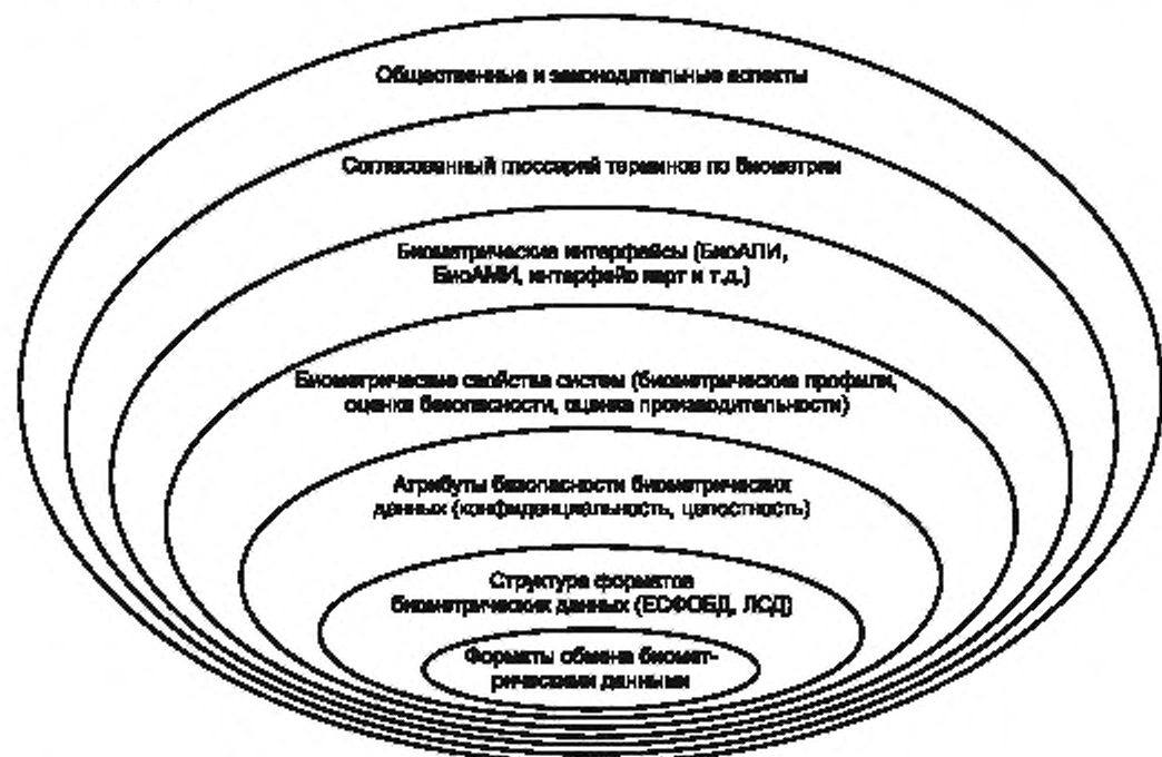
Рисунок 1 - Области стандартизации, относящиеся к биометрии 1)

Взаимосвязь областей стандартизации ИСО/МЭК, имеющих отношение к биометрии, представлена на рисунке 1. Возможность использования биометрической информации зависит от соответствия биометрических данных формату обмена, установленному в настоящем стандарте. Форматы обмена биометрическими данными, установленные в ИСО/МЭК 19785—2007 «Автоматическая идентификация. Идентификация биометрическая. Единая структура формата обмена биометрическими данными», являются непосредственной оболочкой биометрических данных. Поскольку биометрические данные являются конфиденциальными и могут стать объектом кражи или атаки, среды обмена данными должны быть обеспечены средствами защиты информации. Оценка биометрических параметров с точки зрения профилей, уровня безопасности и производительности также является важной составляющей формата обмена биометрическими данными. Интеграция и возможность использования биометрических компонентов требует наличия интерфейсов форматов биометрических данных. При описании технологий обработки биометрических данных рекомендуется придерживаться установленных в комплексе стандартов ИСО/МЭК 19794 формулировок. При развертывании приложений, использующих биометрическую верификацию или идентификацию, необходимо учитывать социальные и юридические требования, которые действуют на конкретной территории и зависят от местной специфики.