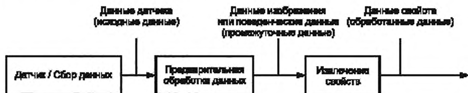
Рисунок 4 — Данные датчика, данные изображений/поведенческие данные и данные свойств

Примеры использования биометрических данных приведены в приложении А.