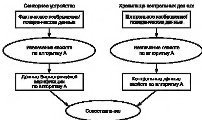
Рисунок А.1 — Использование данных изображений/поведенческих данных

Структуры обмениваемых данных, установленных в комплексе ИСО/МЭК 19794, используют в сценариях в зависимости от их уровня обработки.