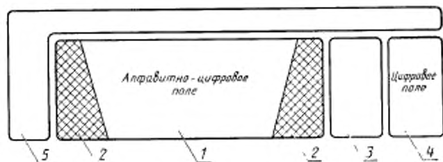
Расположение основных групп клавиш на клавиатуре

1 — алфавитно-цифровое поле; 2 — управляющие клавиши; 3 — поле редактирования; 4 — отдельное цифровое поле (цифровая клавиатура); 5 — функциональные клавиши