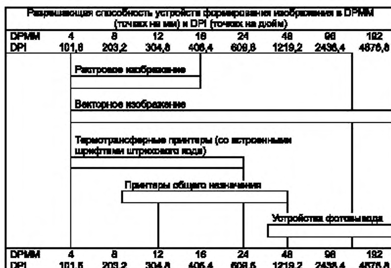
Рисунок Е.1 — Категории устройств создания изображения

Существуют устройства создания изображений, которые не относятся к указанным категориям. К ним относятся цифровые печатные машины, высокоскоростные цифровые печатные машины непрерывного действия, оборудование для прямой печати на печатную форму и устройства печати, регулирующие соотношения скорости подачи и скорости печати или движения игл при контактной печати с целью перекрытия точек. Программистам, разрабатывающим программное обеспечение для таких устройств, рекомендуется подробно ознакомиться с 4.2.1.1, 4.2.1.2 и 4.2.2.