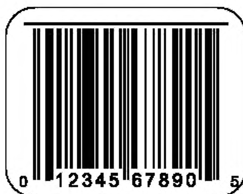
Рисунок С.1 — Линия для выявления дефектных элементов печатающей головки

по ИСО/МЭК 15416, они, тем не менее, могут быть весьма полезны для мониторинга процесса печати. Альтернативный метод обнаружения дефектных точек — печать линии вдоль символа в соответствии с рисунком С.1. Любой точечный дефект, который будет выглядеть как маленький разрыв линии, будет замечен оператору.