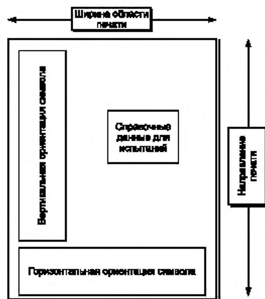
Рисунок А.1 — Образец тестового макета

Макет, изображенный на рисунке А.1, представляет рекомендуемое расположение тестовых символов штрихового кода на тестовой этикетке. Размеры этикетки не определены, ее ширина должна соответствовать ширине области печати конкретного принтера, на котором проводят испытание, а число символов символика и относительное расположение тестовых символов может быть уточнено. Область печати должна распространяться на всю ширину макета, за исключением мест, оставленных для свободных зон до знака Start (СТАРТ) и после знака Stop (СТОП) в тестовых символах.