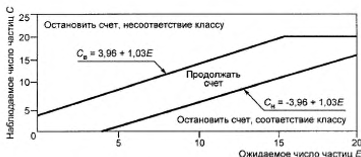
Рисунок F.1 — Границы соответствия и несоответствия классам чистоты при использовании метода последовательного отбора проб

На рисунке F.1 по оси абсцисс отложены значения ожидаемого числа частиц E , если концентрация частиц равна максимально допустимому значению для заданных размеров частиц и класса чистоты (B.4.2). По оси ординат отложены значения наблюдаемого числа частиц C в пробе.