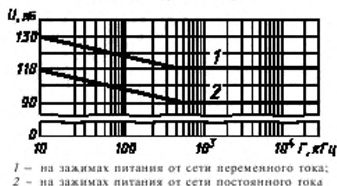
Предельные значения напряжения гармонических помех в полосе частот от 10 кГц до 30 МГц

1 — на зажимах питания от сети переменного тока; 2 — на зажимах питания от сети постоянного тока