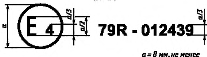
Образец А (см. 4.4)

Приведенный выше знак официального утверждения, проставленный на транспортном средстве, указывает, что этот тип транспортного средства официально утвержден в Нидерландах (Е 4) в отношении механизмов рулевого управления на основании Правил ЕЭК ООН № 79 под номером 012439. Этот номер официального утверждения означает, что официальное утверждение было предоставлено в соответствии с требованиями Правил ЕЭК ООН № 79 с внесенными в них поправками серии 01.