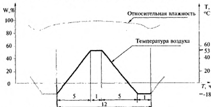
Рисунок А.2 — График одного цикла испытаний (первая часть испытаний по режиму IV)