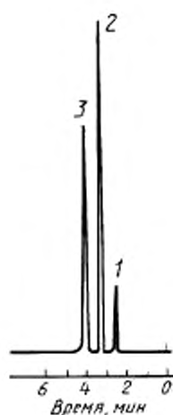
1 — сероводород; 2 — метилмеркаптан; 3 — этилмеркаптан

Рисунок 2 — Типовая хроматограмма сернистых соединений в нефти на колонке с 2 % ОДПН на диатомитовом кирпиче