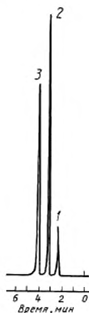
1 — сероводород; 2 — метилмеркаптан; 3 — этилмеркаптан

Типовые хроматограммы сероводорода, метил- и этилмеркаптанов и нефти приведены на рисунках 2—4.