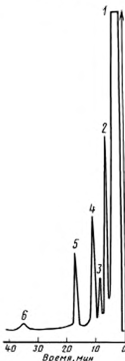
Хроматограмма разделения остаточных мономеров и примесей в полимерах стирола

1 — четыреххлористый углерод; 2 — этилбензол; 3 — изопропилбензол; 4 — стирол; 5 — n -бутилбензол («внутренний эталон»); 6 — бензальдегид