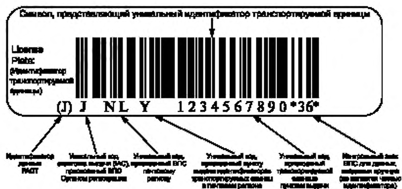
Рисунок В.2 — Пример представления уникальной идентификации транспортируемых единиц в символическом штриховом коде Code 128 (Код 128)

В.2 Пример представления уникальной идентификации транспортируемых единиц в символическом штриховом коде Code 128 (Код 128)** с идентификатором данных FАCT (ФАКТ)*** «J» и визуальным представлением приведен на рисунке В.2.