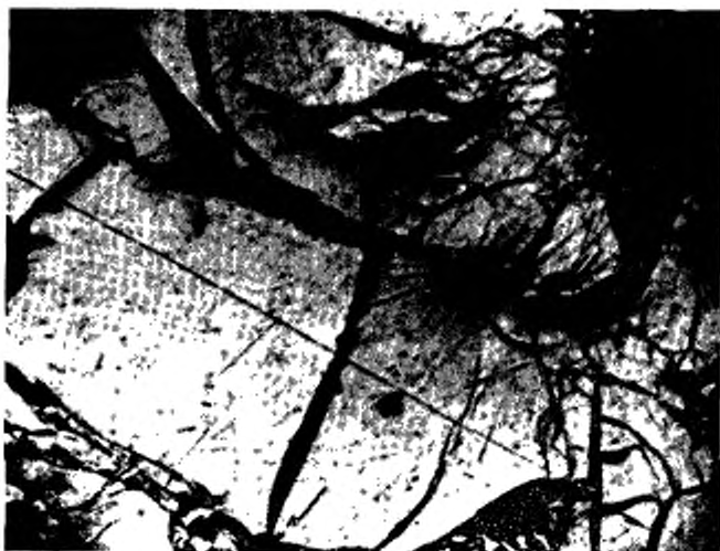
Высокая степень выветрелости угля. Появление дезинтеграции частиц угля и пустот выщелачивания