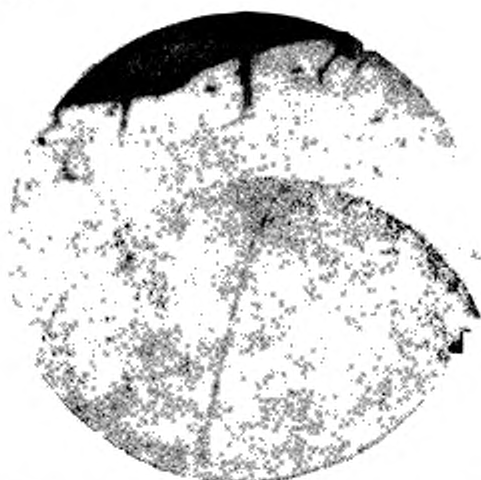
Начальная стадия выветрелости, появление краевых клиновидных трещин Рисунок 2