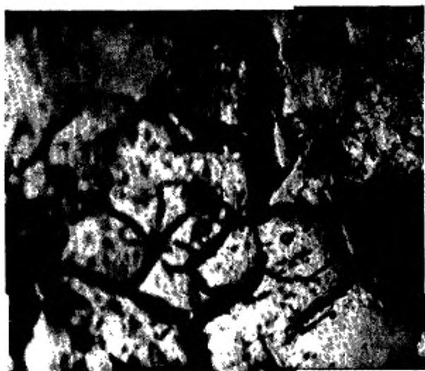
Высокая степень выветрелости угля. Увеличение количества трещин и снижение рельефа в местах их развития