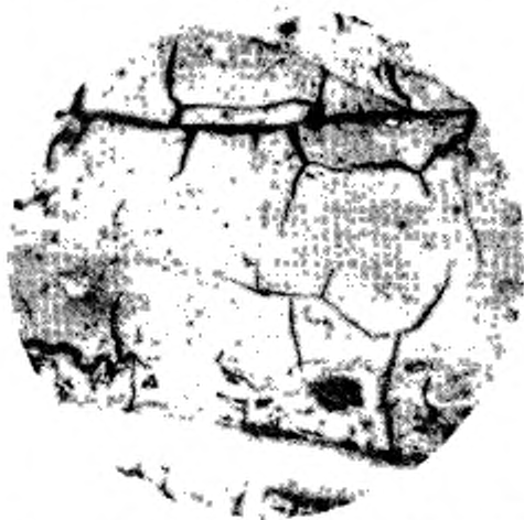
Увеличение клиновидных и образование ветвистых трещин и появление каверн