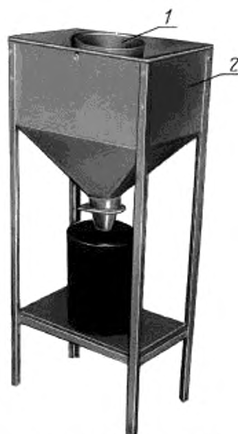
1 — емкость измерителя; 2 — ящик